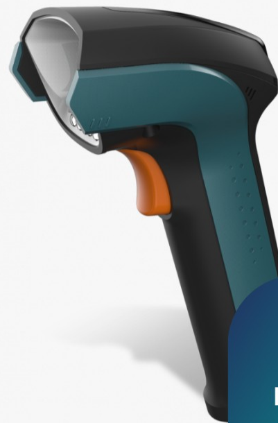
NVH220 Lophius Bluetooth Handscanner